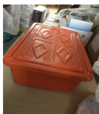
⑮衣装ケース(高 42 横 44 奥 73)