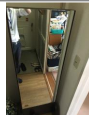
⑯姿見鏡(高 165 横 55 奥 30)