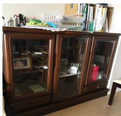
① 棚 (横 115 高さ 100 奥 45)