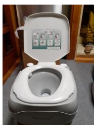
⑤ ポータブルトイレ