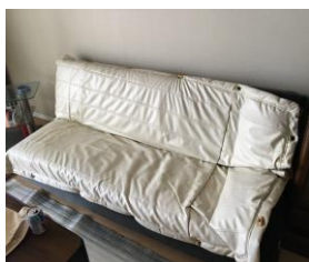
② ソファベッド {182×100 (50) ×32 (82)}