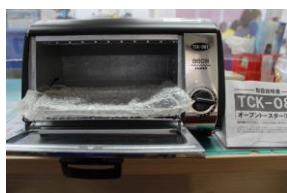
⑥ オープントースター