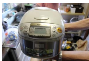
⑪ 炊飯器 NS-TC10 型