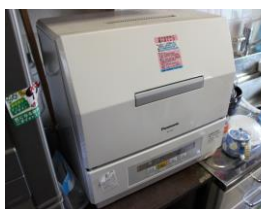
⑩ 食洗器 NP-TCR3