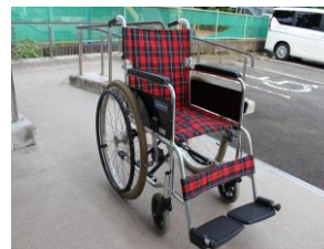
⑧ 車いす(幅 40×奥 40)