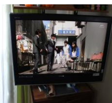
⑨ 37 型テレビ