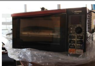
②オーブントースター (2台)