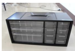
⑨アバンテケース (小物入れ)