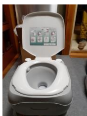
⑤ポータブルトイレ