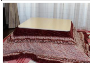
②コタツ(掛ふとん含む)