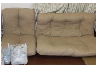
①ソファ(カバーは3人掛用)