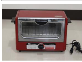
③オーブントースター