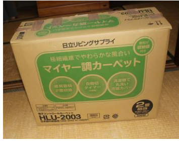
ホットカーペット(2条相当)