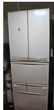
③冷蔵庫 416ℓ(横 65×高 180×奥 60)