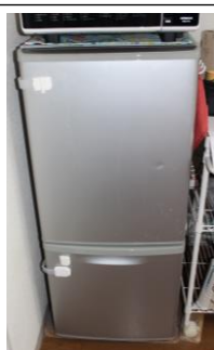
⑤冷蔵庫 141ℓ (横 48×高 110×奥 58)