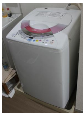
②洗濯機 8 kg