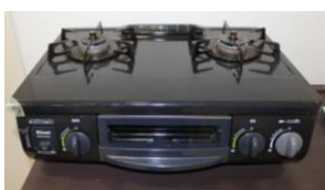
都市ガス用コンロ