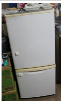
④冷蔵庫 143ℓ (横 48×高 112×奥 55)