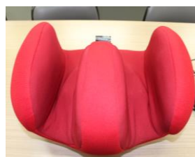
フットマッサージャー