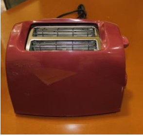
ポップアップトースター