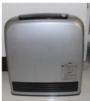
ガスファンヒーター