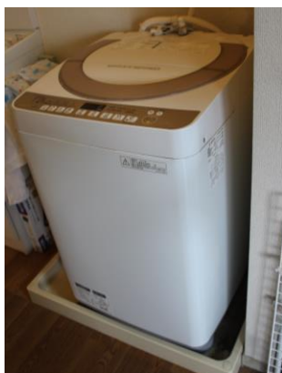
①洗濯機 7 kg