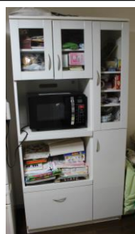
⑥食器棚 (横 92×高 180×奥 44)