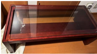
⑥ガラステーブル 幅100・奥45・高33