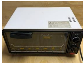
⑦オーブントースター