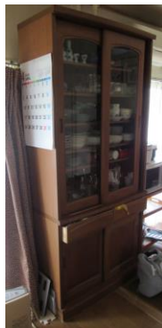
⑫食器棚 幅89 奥38 高194