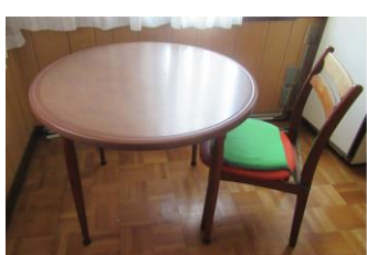
④丸テーブル (直径88・高71) 椅子4脚 単品可