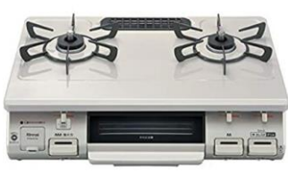
②ガスコンロ (写真はイメージです)