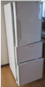
⑤冷蔵庫 265ℓ ・幅54 ・奥63 ・高150