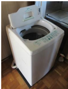
⑥洗濯機(5kg) ・幅51 ・奥51 ・高84