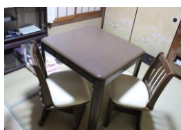
⑨こたつイス付き (横奥85 高70)