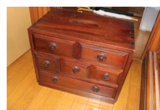
⑧棚(横50 奥30 高40)