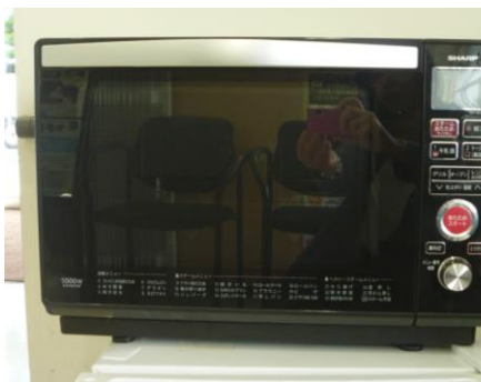
⑬オープンレンジ(高 35×横 50×奥 40)