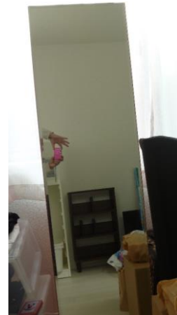
③姿見(高 157×横 40)