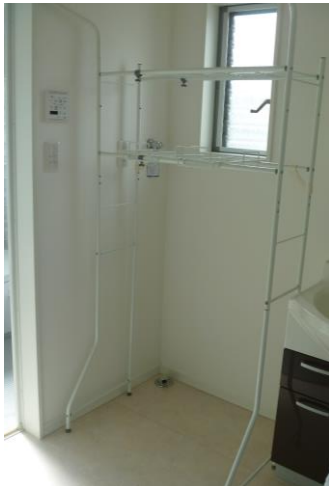
④洗濯ラック(高 185×横 90×奥 45)