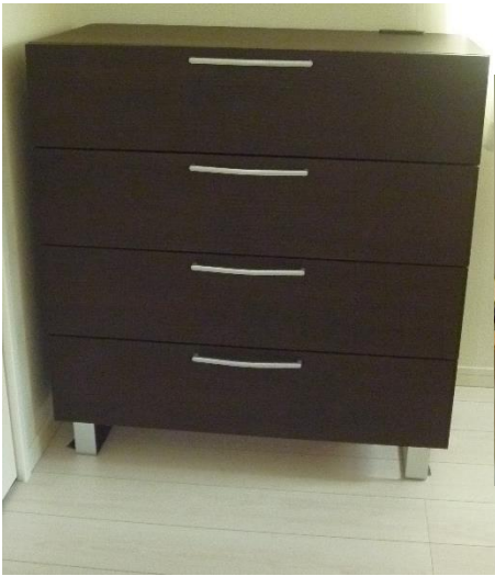
①チェスト(高 95×横 90×奥 45)