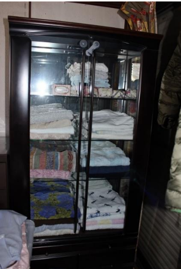
⑬食器棚(横 77cm 奥行 42 cm 高さ 150cm)