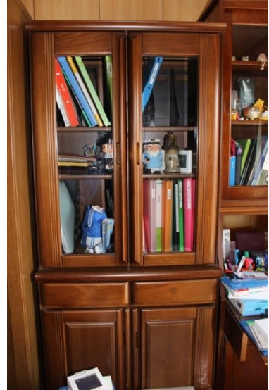
⑨本棚 (横 70cm 奥行 45cm 高さ 175cm)