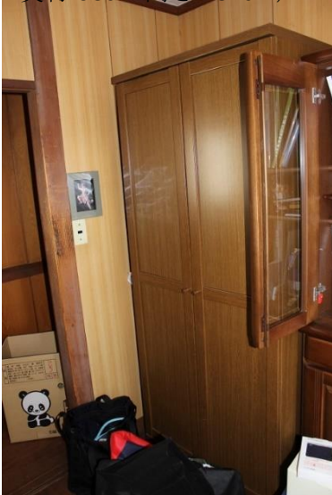
⑩両開洋服ダンス (横 78cm 奥行 58cm 高さ 182cm)