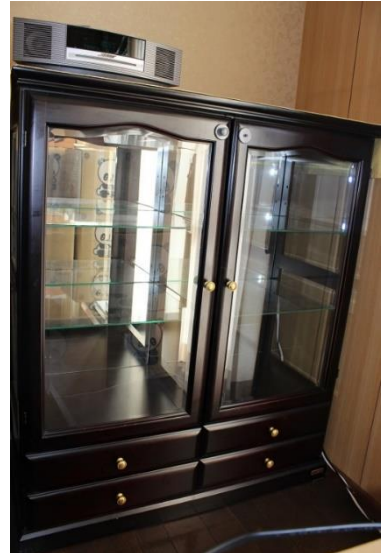
⑫食器棚小 (横 100cm 奥行 45cm 高さ 116cm)