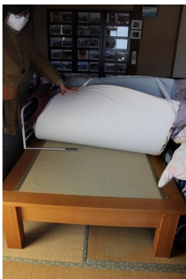
⑯ベット畳(縦212cm横110cm 高さ40cm)