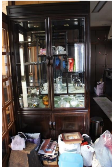
⑪食器棚大 (横 101cm 奥行 36cm 高 198 c m)