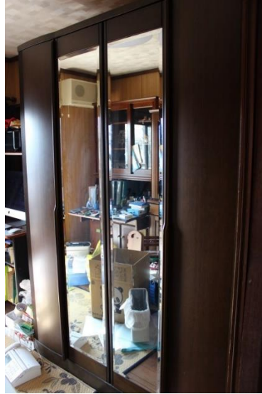
⑧大鏡洋服タンス (横 78cm 奥行 58cm 高さ 182cm)